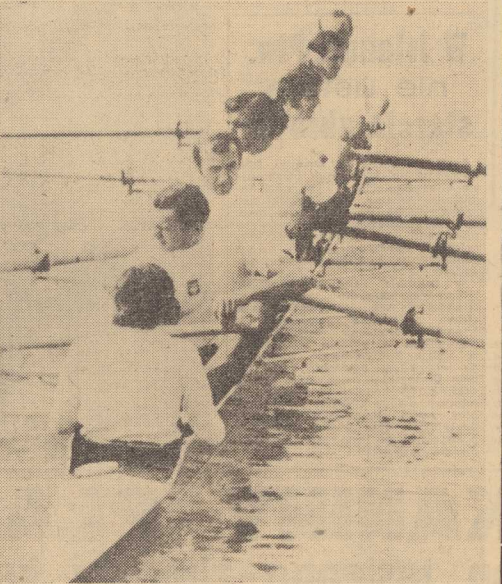
POLSCY wioslarze (ósemka) na torze wodnym w Oberschleissheim w pobliżu Monachium.

BYDGOSZCZ PAP. Miejskańcy Bydgoszczy czynią wszystko, aby jak najlepiej przyjąć rolników z całej Polski, którzy zjadą tu na centralne dożynki w dniu 3 września br. Miasto wdziewa odświętną szatę - odświeżono już domy, założono nowe zieleńce i aleje kwietne, parki. Ogłoszony został dożynkowy konkurs witrzyn i wnetrz sklepowych. Plastycy kuja wielki obelisk Świątowidła, który będzie głównym akcentem okoliczności. „Zawisy” - miejsce, gdzie odbędzie się główna impreza Święta Plonów. Gospodarze szykują się na przyjęcie 6 podległych specjalnych i ok. 500 autokarów z dożynkowymi gośćmi.