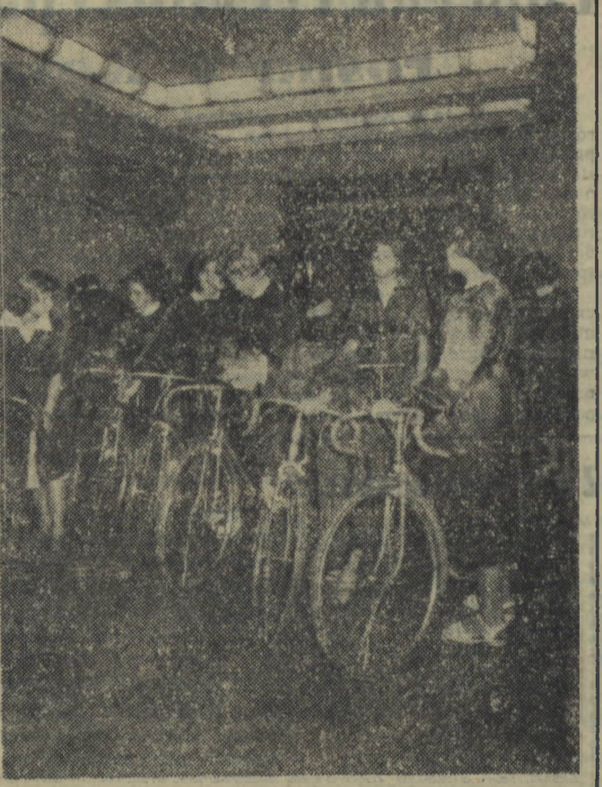
Piękne sale części młodzieżowej Pałacu Kultury i Nauki rozbrzmiewają już młodymi głosami. W pracowniach, czytelni i bibliotece oraz innych salach zagospodarowali się już młodzi gospodarze. Na zdjęciu: dziewczęta z Liceum Pedagogicznego wypożyczyły rowery na wycieczkę nie dzielnie.