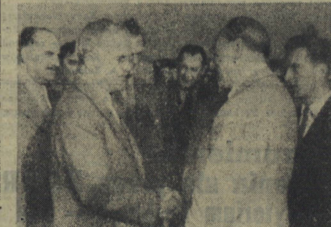
16 września br. do Moskwy przybyła delegacja rządowa Niemieckiej Republiki Demokratycznej. Na zdjęciu: powitanie na lotnisku centralnym w Moskwie.

Nowy piec, jak i poprzednie, wybudowany został w oparciu o pomoc Związku Radzieckiego. Całkowite wyposażenie pieca i wszystkie urządzenia pomocnicze są dziełem rąk setek robotników, techników i inżynierów z radzieckich zakładów przemysłowych.