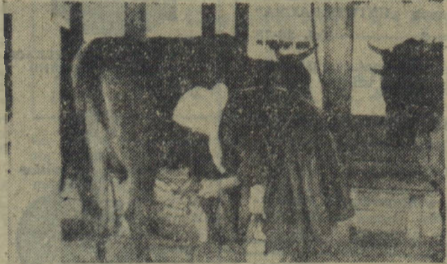
Elektryczne dojenie krow na letniej fermie w Rostowskim Mlecznym Sowchozie Nr 2.

N IE od razu stał się Rostowski Sowchoz Nr 2 wielką, nowoczesną wytwór-