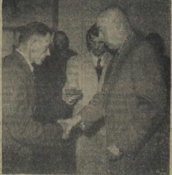
Na zdjęciu: prezes Rady Ministrów Józef Cyrankiewicz dekoruje ordere „Sztandar Pracy” II klasy Józefa Lewandowskiego, przewodniczącego spółdzielni produkcyjnej w Lejkowie, powiat kołobrzec. Spółdzielnia w Lejkowie osiągnęła wysokie plony z hektara: pszenicy 24 q, żyta 23 q, jęczmienia 25 q, owsa 26 q, buraków cukrowych 369 q, ziemniaków 290 q.