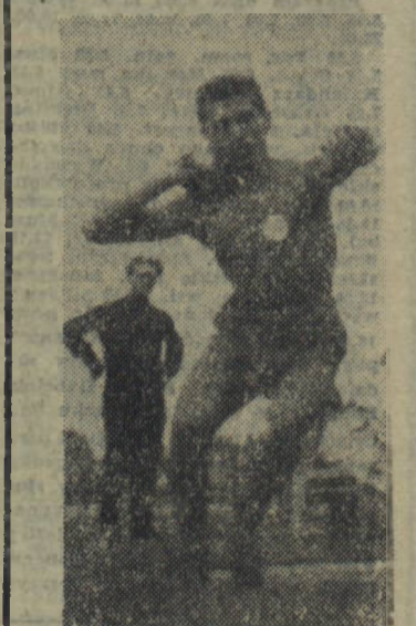
W Warszawie na stadionie „Koszarza” odbyła się I Ogólnopolska Spartakiada PGR.

Na międzynarodowym turnieju tenisowym w Belgradzie duży sukces odnieśli zawodnicy polscy. W grze pojedynczej kobiet Jędrzejowska zdobyła pierwsze miejsce. Zwycięstwem Polaków zakończył się również finał gry podwójnej mężczyzn.