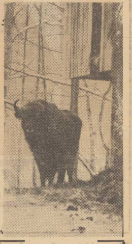
PO TYM ZDJĘCIU, wykonanym z bliskiej odległości, Zubry zatakowały fotoreportera.