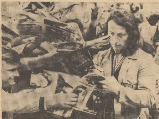
NA ZDJĘCIU: piosenkarz węgierski Zoltan Szevanovity wśród tancerzy autografów.