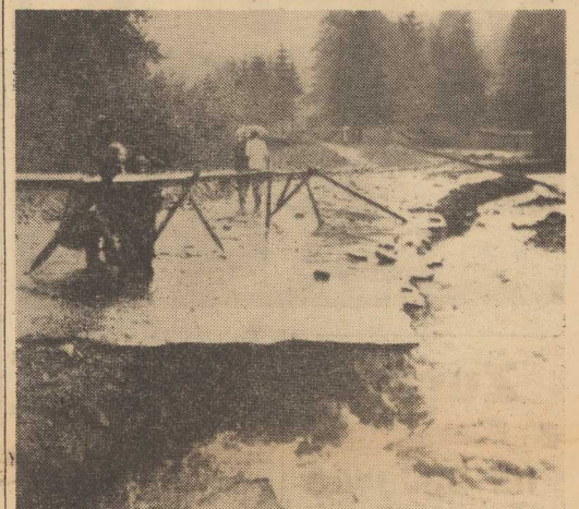
Na zdjęciu: zniszczona w skutek podmycia jezdnia w Jaszowcu koło Ustronia.