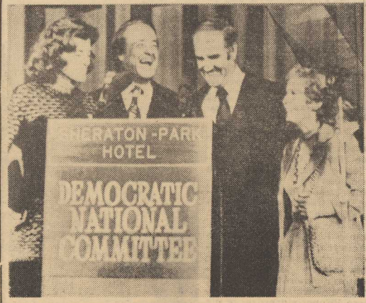
...HOTEL... ...DEMOCRATIC... ...NATIONAL... ...CONFERENCE... KRAJOWY Komitet Partii Demokratycznej, który obradował 8 bm. w Waszyngtonie, oficjalnie desygnował Sargenta Shrivera kandydatem na wiceprezenta USA. Na zdjęciu: S. Shriver (z lewej) i senator G. McGovern wraz z żonami po ogłoszeniu decyzji komitetu.

W toku rozmów handlowych uzgodniono kontrakt na rok przysyłający na sumę 1,5 miliona rubli. W przyszłorocznym eksporcie dominować będą jachty, przede wszystkim łodzie małe, przeznaczone do szkolenia młodych żeglarzy. Dostawcami