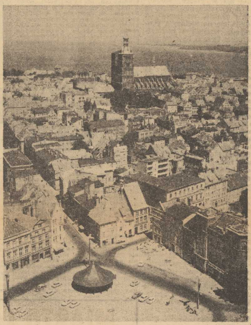
WIDOK na Stralsund (NRD) i Cieśninę Strela ze szczytu stn metrowej wieży kościoła Mariackiego.

Zainteresowanie występami „Mazowsza”, mimo szczytów sezonu letniego, jest olbrzymie. Na pierwszy tydzień wykupiono już wszystkie bilety.