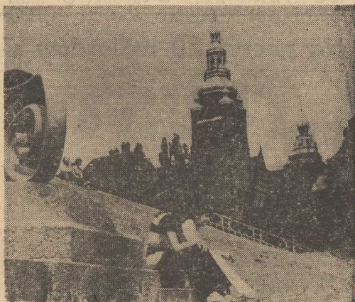
CHWILA wypoczynku na Wałach Chrobrego.