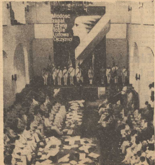
MŁODZI delegaci woj. szczecińskiego podczas wczorajszego spotkania w Zamku.

DZIŚ W STOLICY POLSKIEGO PRZEMYSŁU WŁOKNIENICZEGO, miście bogatych tradycji rewolucyjnych — Łodzi rozpoczyna się wielkie spotkanie przedstawicieli młodego pokolenia Polaków — Zlot Młodych Przewodników Pracy i Nauki. Inauguracja spotkania blisko 5,5 tys. młodych delegatów nastąpi w późnych godzinach wieczornych w czasie uroczystego apelu na terenie miasteczka złotowego.