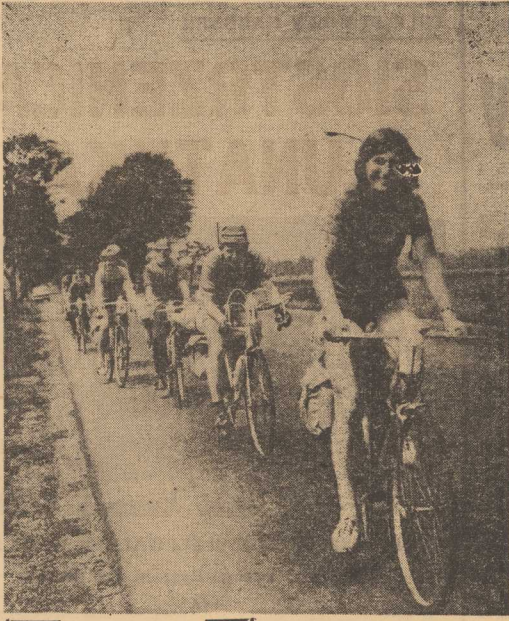
NA WYCIECZKĘ rowerową po Polsce wybrała się 13-osobowa grupa młodych turystów z klubu sportowego Sokół Studenec (CSRS). Młodzi Czesi zamierzają przejechać w ciągu 18 dni 1 600-kilometrową trasę, wiodącą po terenach naszych południowych województw.