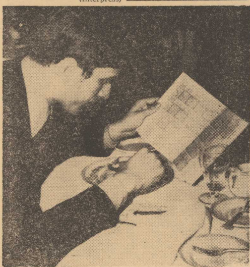
Fischer, nawet podczas posil ków nie przestaje studiować partii Spasskiego.

DZIENNIK „Information” oświadcza wręcz, że Bobby Fischer boi się spotkania z radzieckim mistrzem. Dla niego nie jest to gra wyzwanie o tytuł i wyzwanie o pieczęć. Fischer, niejednokrotnie twierdził publicznie, że radziecka jest wyjątkiem „znowy i manipulacji”. Niejednokrotnie porwał się na pogardliwe traktowanie radzieckich mistrzów i z trudem ukrywał wściekłość. Kiedy przyszedł mu podczas dotychczasowych spotkań ze Spasskim przegrwać lub remisować. Przed obecnym mistrzostwami świata, na które miłośnicy szachów czekali jak na „mez stulecia”, oświadczył bunciecznie, że tym razem „pokaże radzieckiej szkole robotów co znaczy wolny umysł zachodniego świata”. Amerykański aparat propagandowy nastawił się na te „lekcje” z całą swoją techniką i sprawnością. Dla skandynawskich obserwatorów nie ulega wątpliwości, że miał być to swoisty mat na szachownicy zimniej wojny. To co pokazał dotychczas Bobby skutecznie skomponowało te zamiary. Pierwsza partia przegrana przez poddanie, druga — w atmosferze międzynarodowej skandali — oddana walkowerem mimo protestu arcymistrza.