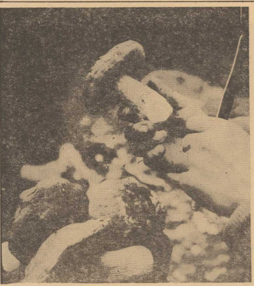
LASY województwa olsztyńskiego zaroiły się od amatorów gryzobrania. Dziennie niekiedy „grzybiarze” zbierają nawet po 400 sztuk zdrowych prawdziwków. Na zdjęciu: oto dorodne prawdziwki zebrane w lasach koło Łęczyny w ciągu pół godziny.

POLICJANT dyżurujący na jednej ze stacji paryskiego metra zwrócił uwagę na dziwne zjawisko. Oś, dziecko trzymające na rękach przez żebraćki, płakało dokładnie przez 3 godziny, ponawiając trzygodzinną akcję po krótkiej przerwie. Dochodzenie wykazało, że żebraćki używano na drodze lalki z magnetofonu, na którego taśmę nagrano dźwięki szloch.