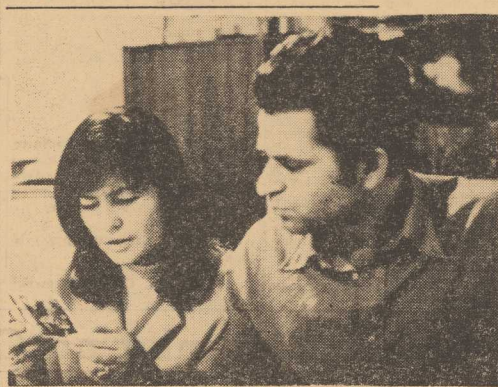
Borys Spasski wiele czasu poświęca żonie Larisie...