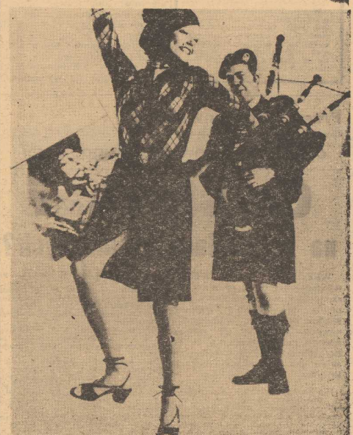
SPORTOWY strój wzorowany na klasycznej modzie szkockiej. Wszystko zależy od kratki i dużego beretu z pomponem.