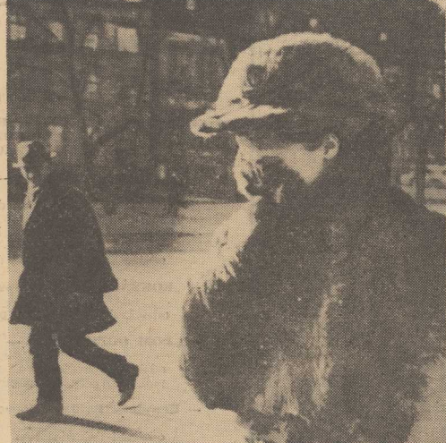
ALE MROZU! Słupkę rzeź na termometrze wskazuje 15 stopni poniżej zera. Trzeba się więc szalenie otulić...