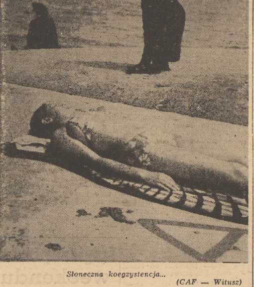
Słoneczna koezystencja...