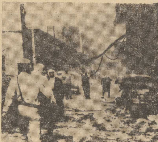
21 BM. siły lądowe i powietrzne Izraela dokonały kolejnej napaści na południową część Libanu. 48 Libańczyków poniosło śmierć, a 55 zostało rannych. Na zdjęciu: zniszczenia w ubańskim mieście Hasbia.

Jak będzie teraz? Agencje doniosły o naciskach na rząd Libanu ze strony prawicy chrześcijańskiej, za interesowanej w utrzymaniu neutralności tego kraju nawet za cenę rezygnacji z traktowania sprawy palestyńskiej jako odcinka ogólnoarabskiej walki z izraelskim wrogiem. I chociaż solidarność społeczeństwa libańskiego z pobawionymi miejscami na ziemi uchodźcami palestyńskimi hamuje zamiary wyrwania Libanu ze wspólnego frontu krajów arabskich, to z drugiej strony siła ruchu palestyńskiego zachęca prawicowe elementy w tym kraju do działania. Ten właśnie element sytuacji wleża do swoich planów Tel Awiw.