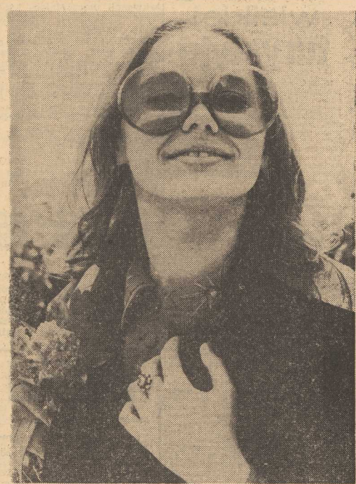
„SZCZECINIANKA JESTEM...”