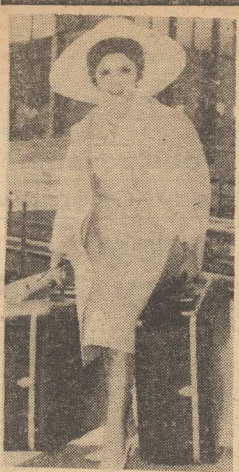
GINA LOLLOBRIGIDA nie wygląda na bezradną na rzymskim lotnisku. Strajk personelu nazimnego lotniska sparaliżował życie tego zwykle ruchliwego portu, lecz aktorka daje sobie doskonale radę z bagażami.

W dalszym ciągu utrzymuje się silne napięcie w dzielnicach katolickich i protestanckich, a sytuacja zognia obecność wojsk brytyjskich. Brak perspektyw rozwiązania kryzysu.