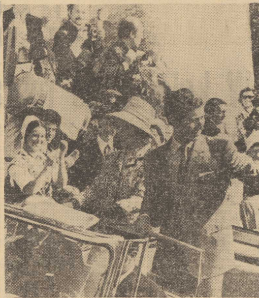
KRÓLOWA brytyjska Elżbieta II, która przebywa z wizytą w Francji, z widzieli 17 bm. w towarzystwie swego syna Karola pałac w Avignon.

Na zdjęciu: królowa i książę Karol odpowiadają na powitania mieszkańców Avignonu.