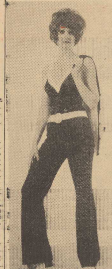
WYGODNY komplet ze spodniami, górna część o kroju przypominającym kostium kaniowej, białe ramiączka są jednocześnie lamówką głołkową dekolte. Kombinacja uzupełnia biały sweter z ozdobioną czarną lamówką.