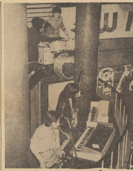
NA ZDJĘCIU: — zespół „A PROPOS” z klubu studenckiego „Kubus”.

Chcielibyśmy mieć dobre zrozumienie. Nie zamierzamy negować pracy pracowników handlu, do posiadania własnej stołówki. Wręcz przeciwnie: będziemy popierać takie postulaty. Czy jednak nie było innej możliwości otwarcia stołówki, jak tylko likwidacja restauracji? Bo zastanawiamy się: jeśli dalej będziemy w ten sposób rozwiązywać gastronomiczny problem w naszym mieście, to wkrótce może narodzić się pomysł przekształcenia „Kaskady”... w przyzakładowy dom kultury. (ten)