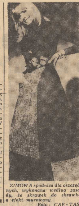
ZIMOWA spódnica dla oszczędnych, wykonana według zasady, że skrawek do skrawka, a efekt mrurowany.

eksperyment japońskich naukowców Podwodne magazyny NAUKOWCY JAPONSKI z uniregulowanej temperaturze. Ziarno wstępuje w Kyoto zajmował się, w ciągu kilku ostatnich lat zagadnień zmian smaku, aromatu i wyglądu zewnętrznego. Wyniki uzyskane dla pszenicy i soi były podobne jak dla ryżu. Japońscy naukowcy są zdania, że magazynowanie zboża pod wodą przyniesie znaczne korzyści. Koszty konstrukcji kontenerów podwodnych i ich konserwacja powinny być niższe od kosztów składowania zboża w magazynach o kontrolowanej temperaturze i wilgotności powietrza. Ponadto podczas magazynowania zboża nową metodą nie występuje problem związania szkodników i infekcji pleśni. Opracowano już projekt składowania pod wodą około 10 tys. ton zboża. (AR — WEZ)