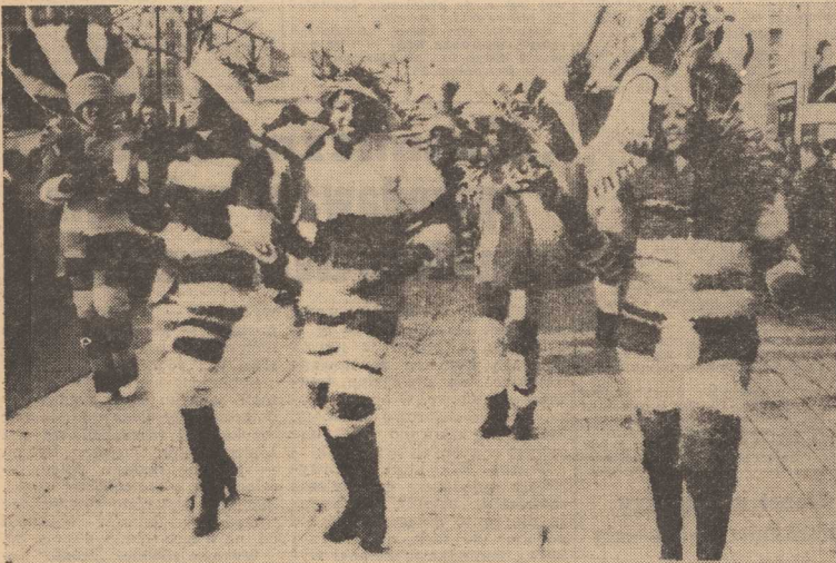
DZIS w numerze: ♦ W Zamku — sztuka A. Dejneki ♦ Statki nie mogą czekać ♦ Ludzie, którzy przybyli z morza ♦

Z OKAZJI tegorocznego karnawału przybył do Paryża regionalny, 25-osobowy zespół z Wysp Bahama. NA ZDJĘCIU: występ tancerzy na jednej z ulic Paryża.