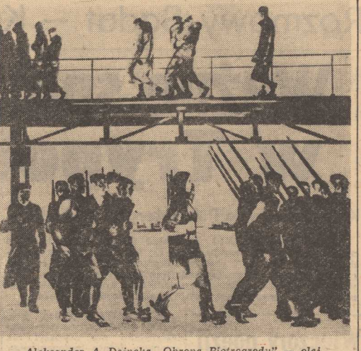
Aleksander A. Dejneka „Obrońca Piotrogradu” — olej.

Dokonane zmiany w gospodarce finansowej handlu zagranicznego oraz w systemie nagradzania stanowią wyraźny postęp w doskonaleniu systemu zarządzania i planowania, dzięki czemu sprzyjać będą dalszej aktywizacji obrotów handlowych Polski z zagranicą.