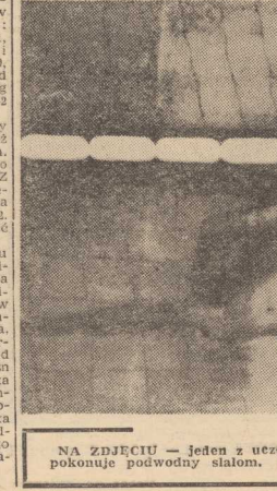
NA ZBIERACI — jeden z uczestników zawodów pletwonurków pokonuje podwodny slalom.

Rozgrywki finałowe IX Turnieju Najlepszych w piłce siatkowej odbędą się w dniach od 4 do 6 maja w hali sportowej przy ul. Narutowicza. O palmę pierwszeństwa w grupie pań ubiegać się będą 4 drużyny: Wojewódzka Rada Narodowa, Stoczniak Szczeciński im. A. Warskiego, SZWS „Wiskord” i Zarząd Portu Szczecin. W finale mężczyzn znalazło się 7 zespołów: Miejska Pracownia Geodezyjna, Elektromontaż, Szczecińska Stocznia Remontowa „Gryfa”, Stoczniak Szczeciński im. Warskiego, Szczecińskie Przedsiębiorstwo Budownictwa Ogólnego Nr 1, Hydroma i Szczecińskie Zakłady Piwowarsko-Słodownicze. (jg)