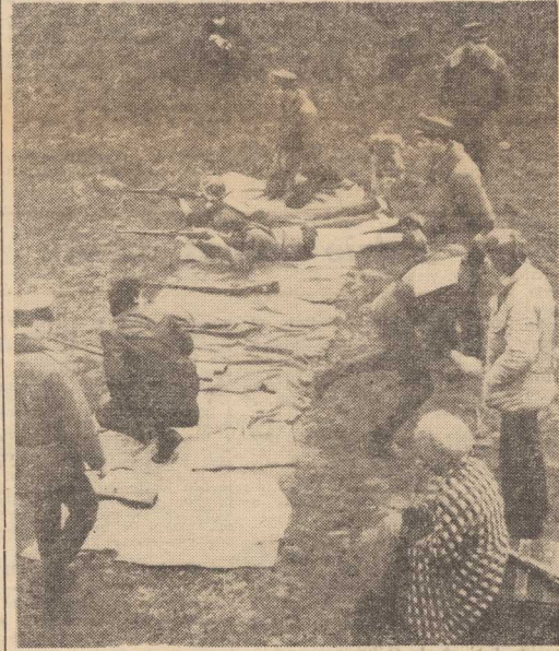
STRZELANIE należało do najtrudniejszych konkurencji trójboju obronnego. Liczył się bowiem nie tylko czas, ale przede wszystkim celne trafienia.

MINIONA NIEDZIELA obfitowała w Szczecinie w szereg atrakcyjnych imprez sportowych. Na Podzamczu odbył się niecodzienny pokaz gry w szachy „żywym figurami”. Widowisko w średniowiecznej scenarii Zamku i figury w strojach wojów i margrabów oglądane były przez tysiące szlachcian. Na pływalni WDS spotkali się pletwonurkowie, którzy ubiegali się o nagrodę „Gryfa Szczecińskiego” w podwodnej specjalności swobodnego nurkowania, natomiast strzelnicze zlokalizowane na torze motorosowym gościli 61 zespołów szkolnych walczących w tzw. trójboju obronnym.