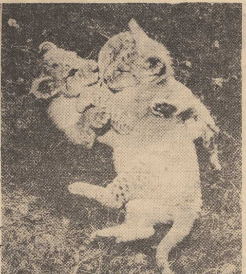
MAŁE lwiątka z tegorocznego przychówku.