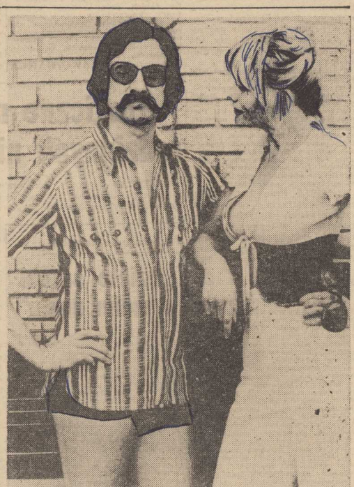
MODA na lato — propozycje dla pana i pani...

LONDYN PAP. Żołnierze brytyjscy zastrzelili w niedzielę w Armagh w Irlandii Północnej 19-letniego chłopca. Jego kolega w tym samym wieku został ranny i przewieziony do szpitala w stanie ciężkim. Baza armii brytyjskiej twierdzi, że żołnierze otworzyli ogień w obronie patrolu, który został ostrzelany z broni maszynowej. Mieszkańcy dzielnicy oświadczają natomiast, że żołnierze otworzyli ogień do chłopców bez powodu.