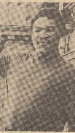
AKTUALNY mistrz świata w szachach w boksie George Foreman odbywa obecnie podróże po stolicach europejskich. Na zdjęciu: Foreman w Paryżu.