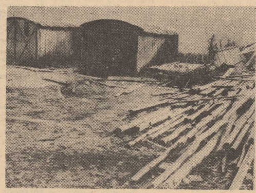
Wiosna — pora generalnych porządków

PRZED kilkoma dniami, pisząc o pracach komisji porządkowej, poruszyliśmy istotny problem stanu obszarów administrowanych przez Zarząd Gospodarki Terenami. O te spore place, często leżące w samym centrum miasta, praktycznie nikt nie dbał, nie sprzątał. Były zatem, i w większości wypadków są nadal, brudnymi plamami w miejskim pejzażu. Może jednak niebawem coś się zmieni. Zauważyliśmy bowiem, że na terenie przy al. Wyzwolenia (obok ZPO „Dana“) zaczęto prace porządkowe. Oby były zapowiedzią generalnych porządków na wszystkich obszarach podległych ZGT.