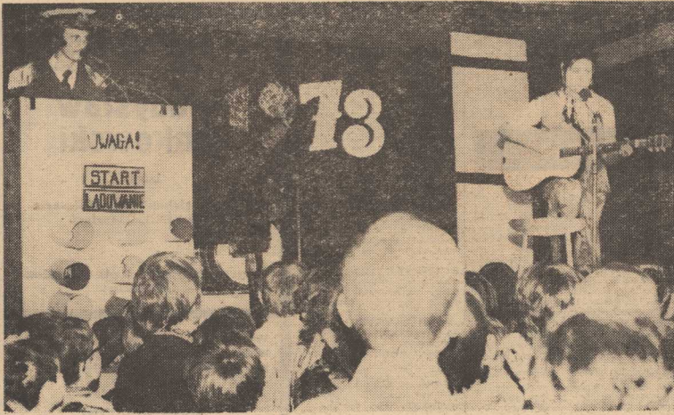
NA ZDJĘCIU: Samolot „Jumbo Jet” wylądował w Ameryce Południowej. Farmerka Mary śpiewa piosenkę kowbojską, po której kapitan statku zaprosił wszystkie dzieci do wspólnej zabawy.