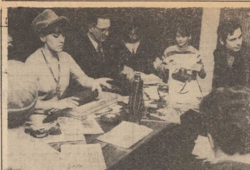
JAK już informowaliśmy w sobotę odbyło się w naszej redakcji uroczyste wręczenie nagród laureatom konkursów o Czechostowacji. Na zdjęciu: zwycięzcy konkursów.