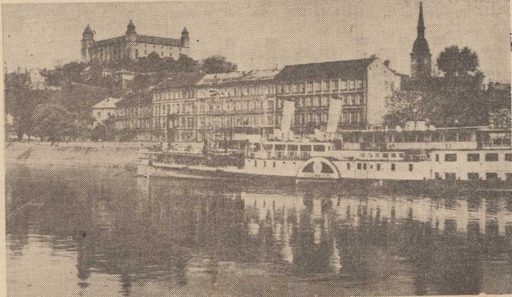
STOLICA Słowacji — Bratysława. Na zdjęciu — przystań rzeczna na Dunaju, z lewej — malowniczo położony na wzgórzu zamek.

Od początku roku 1972 poddawane jest próbom ultradźwiękowe urządzenie do spawania dziurek do guzików. Próby te przeprowadza się w dwóch słowackich zakładach włókienniczych „Tatrasvit” we Svítcie i „Trikota” w Vrbovej.