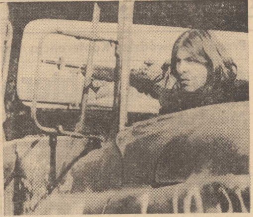
NA ZDJECIU: indyjski posterunek w wypalonym samochodzie policyjnym.