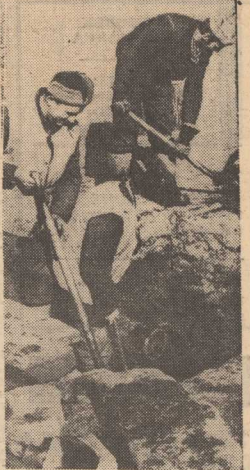
Brigada Józefa Chojnowskiego pracuje przy remoncie podmyte studzienki ściekowej w Dąbju przy ul. E. Gierczak.

WYCHOWANKOWIE Państwowego Domu Dziecka Nr 3 w Policach serdecznie dziękują pracownikom Wydziału Gospodarki Narzędziowej Stoczni Szczecińskiej im. A. Warskiego za przekazanie im z okazji Nowego Roku paczkę i książki. Dziękują także jednostce wojskowej z Polic za zaproszenie na zabawę.