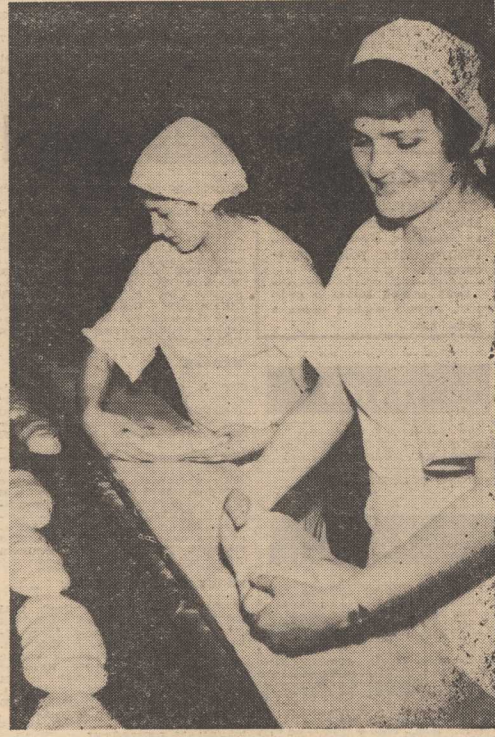
NA naszym zdjęciu: Sprawne dłonie dziewcząt układają bułki wrocławskie na płycie pieca.

▼ LUCJA PRYS, Włodzimierz Nahorny i duet Gitar Klasycznych Albert and Strobel wystąpią w cyklu pt. „Prezentacje jazz'owe” jutro, 20 bm, o godz. 19 i 20.30 w Zamku Książąt Pomorskich.