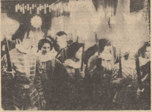
INAUGURACJA Roku Kopernikowskiego w Toruniu. Pochód młodzieży w historycznych strojach.