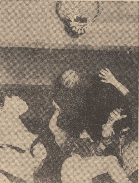
CZY będą 2 pkt.?