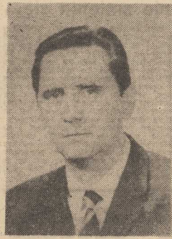
(Dokończenie ze str. 1)

★ „KURIER”: Jakie cele stawia przed sobą Kongres i jakie problemy stanowią dla najważniejszych tematy obrad?