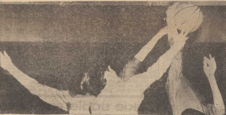
KTO wyżej, szybciej, skuteczniej.

SZTUKA kołowana opanowana na lekcejach w tutaj nie wystarcza. Potrzebna jest maksymalna koncentracja by utrzymać w ryzach „niesfornej“ piłkę.