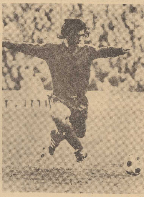
Tanec z piłką w wykonaniu Gerda Muellera.

A to zestawienie par XV kolejki spotkań rundy jesiennej: Górnik — Szombierki, Legia — Ruch, ŁKS — Szombierki, Pogon — Śląsk, ROW — Lech, Zagłębie S. — Stal, Odra — Wisła, Polonia — Zagłębie W.