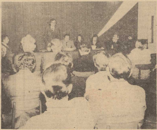
NA ZDJĘCIU: Kandydaci na radnych podczas spotkania z wyborcami.

Lokatorzy, wyborcy, przyglądają się im bacznie. Kim są? Jeśli ich wyberzemy, czy podolają trudnym obowiązkom? Jakiego problemu naszego województwa, miasta, śródmiejskiej dzielnicy uważają za najistotniejsze, za najbliższe do rozwiązania? Którym z nich będą się starali poświęcić najwięcej uwagi? Pytania te niejako malują się na twarzach osób przybyłych na spotkanie z pretendentami do zaszczytnych funkcji radnych.