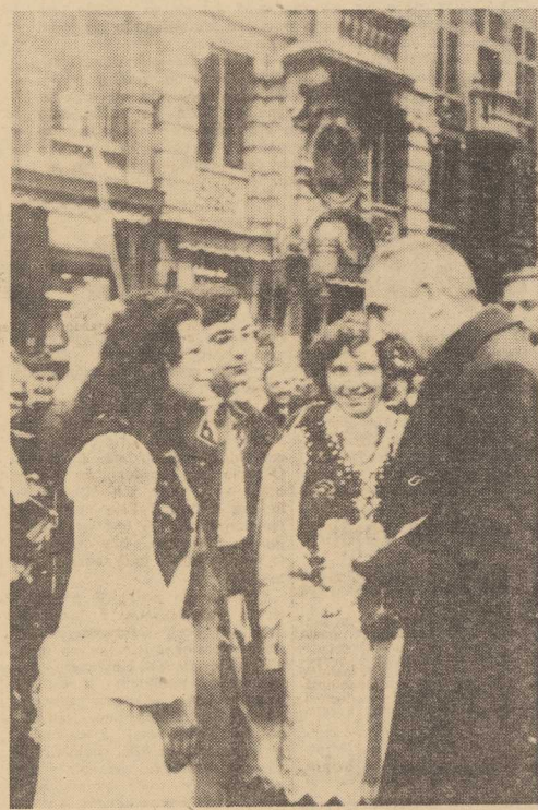
19.11.11. I sekretarz KC PZPR Edward Gierek rozpoczął oficjalną wizytę państwową w Belgii na zaproszenie rządu belgijskiego i premiera Edmonda Leburtona. Na zdjęciu: przedstawicielki Polonii belgijskiej witają E. Gierka na Grand-Place przed Ratuszem. (CAF)

MEKSYK PAP. Północno-wschodnie prowincje Kolumbii nawiedziła groźna powódź, w wyniku której 85 tys. ludzi znajduje się bez dachu nad głową, a 50 tys. mieszkańców tych rejonów ewakuowano. Zanimowano 10 wyspówk utonięć. Szkody gospodarcze szacuje się na 80 mln dolarów.