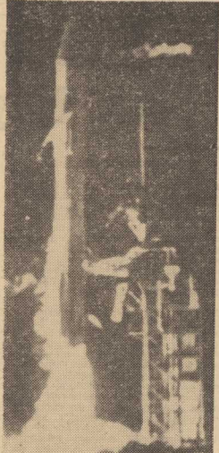
Z PRZYŁADKA Canaberal na Florydzie wyrzuciono 3 bm. automatyczną stację międzyplanetarną MARINER-10. Lot MARINERA będzie trwał 5 miesięcy, a celem jego jest zbadanie planety Merkury.

rii udziału polskich oficerów w grupie obserwatorów zagranicznych w Nigerii po zakonczeniu wojny domowej i obecnie w MKKIN w Wietnamie. PRASA japońska na pierwszych kolumnach szeroko informuje o decyzji w sprawie udziału Polski w UNEF. Podkreśla się, że powołanie kraju socjalistycznego do sił doraźnych ONZ jest wydarzeniem precedensowym, otwierającym nową fazę w historii tej organizacji. Japońskie radio i telewizja przypominały z racji tej decyzji udział naszego kraju w międzynarodowych komisjach działających w Korei i Wietnamie.