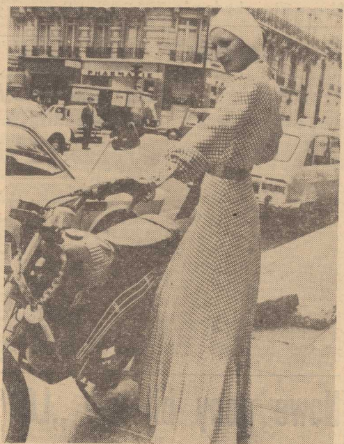
Naturalnie nie do jazdy motocyklem ale na uroczystą okazję wieczorową zaprezentował tę romantyczną wersję smizerki: znany paryski dyktator mody, Dalman.

JUŻ w tym miesiącu polskie rybołówstwo wykona roczny plan połowów, który zobowiązuje tak żalugi przedsiębiorstw łowczych, spółdzielni, jak i rybaków indywidualnych do złowienia 540 tys. ton ryb. Wszystko wskazuje na to, że do końca (Dokończenie na str. 2)