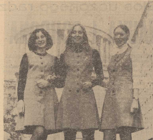
DZIEWCZĘTA zatrudnione w Centrum Informacji Turystycznej w Londynie otrzymały nowe, modne i praktyczne uniformy; bezrękawniki z szarego dżerseju noszone do białych lub czarnych sweterków oraz - zimną - do czarnych spodni. (CAF-AP)

Konkursy, konkursy... Szczeciński Oddział ZLP wraz z Wydawnictwem Poznańskim oraz Wydawnictwem Kultury Prez. Miejskiej Rady Narodowej w Szczecinie ogłosił konkurs otwarty na opowiadanie o tematyce współczesnej. W konkursie tym mogą brać udział mieszkańcy naszego województwa, którzy nie należą do Związku Literatów Polskich. Każdy uczestnik ma prawo nadać tytuł opowiadania - dotyczy ono nie publikowane, przynajmniej raz, w literaturze, w którym tekst każdego z nich nie może przekraczać 20 stron maszynopisu. Prace należy przysłać do: KSIĘŻYCA, Oddział ZLP, Szczecin, ul. Łankwitszczyńska 1, z dopiskiem "Konkurs na opowiadanie". Organizatorzy przewidują trzy nagrody: I - 4 tys. zł., II - 3 tys. zł., dwie trzecie po 1 000 zł.