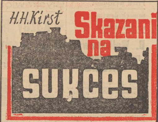
Przełożyła: Brygida Jodkowska

Odwołanie należy odnotować pokazane gościnnie programy zagraniczne: czechosłowacki - o Koperniku, węgierski „Żywa krzyżówka”, polski „Omega”, „Gryfina” i „Wojna”. W tym kierunku klub „Omega”, a swój redowód wywozi z polskiego scenariusza przedstawionego na II