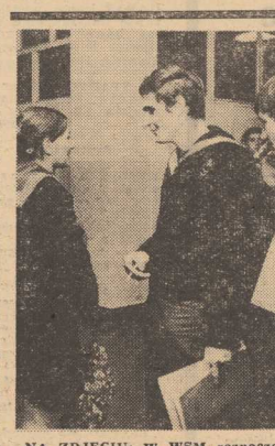
NA ZDJĘCIU: W WSM rozpoczęły się już normalne zajęcia...

Rektor i Senat uczelni gorąco zapraszają wszystkich mieszkańców naszego miasta do wzięcia udziału w uroczystościach inauguracji roku akademickiego. Program imprez zaopiniuje się niezwykle interesująco. Szczecinowi przybyli jeszcze jeden akcent morski — liceum na pokładzie statku, wydaje się zatem, że warto przyjeść w niedzielę na Waty Chrobrego. (awa)