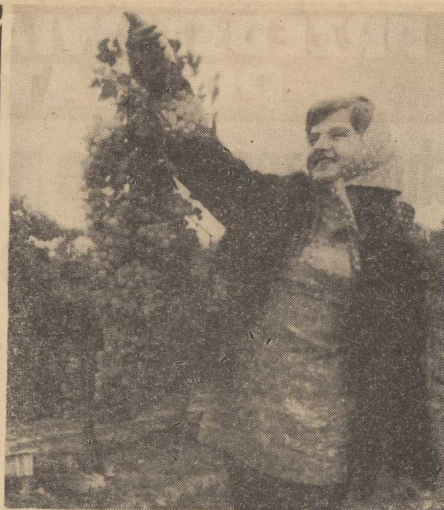
NA WĘGRZECH sezon winobrania w pełni. W państwowej winnicy Egypcy w rejonie Hajdu-Bihar, zbiór winogron z hektara wynosi 100 kwintali. (CAF—PI)

Aleksander WINOGRADOW wiceprezes Akademii Nauk ZSRR