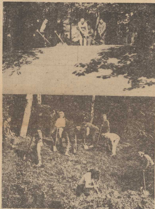
NA TERENACH przyszłego ogrodu dendrologicznego, nikt nie odpooczywał. Robota — jak to się mówi — dostownie paliła się wszystkim w rękach.

Mając na względzie istotne, długofalowe interesy narodów — radzieckiego i chińskiego — Związek Radziecki konsekwentnie opowiada się za przywróceniem stosunków do brego sąsiedztwa i współpracy z Chińską Republiką Ludową na podstawie przestrzegania zasad wzajemnego poszanowania suwerenności, równoprawności i niemieżania się w sprawy wewnętrzne.