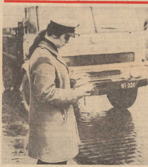
W AKCJI, przeprowadzonej wczoraj przez Wydział Prewencji i Ruchu Drogowego KW MO poddano kontroli kilkadziesiąt pojazdów mechanicznych. Za jej sprawne przeprowadzenie należą się słowa uznania milicjantom z popularnej „drogówki”. (p)