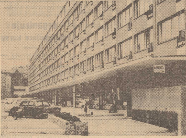
OSIEDLU mieszkaniowemu przy ul. Odziewej przybył niedawno nowy, piękny gmach, w którym znalazło pomieszczenie wiele bardzo potrzebnych w tym rejonie placówek handlowych i usługowych.