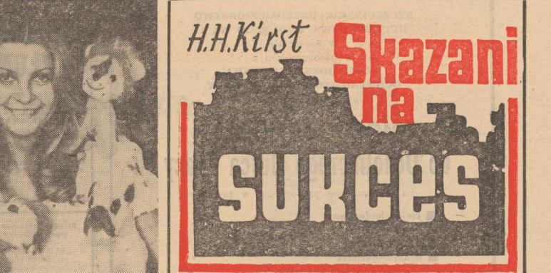
(Tytuł oryginału: Verdammst zum Erfolg) Przełożyła: Brygida Jodkowska

Na stacji autobusów jest okropnie ciasno i brak miejsca do parkowania pojazdów. W tym celu należy wybudować nowe miejsce parkingowe. W tym celu należy wybudować nowe miejsce parkingowe. W tym celu należy wybudować nowe miejsce parkingowe.