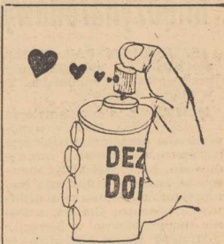
BEZ SŁÓW.