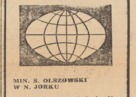
MIN. S. OLSZOWSKI W N. JORKU

W związku z fałsz prowokacji Tel Awiwu obserwatorzy w Libanie zwracają uwagę na o-