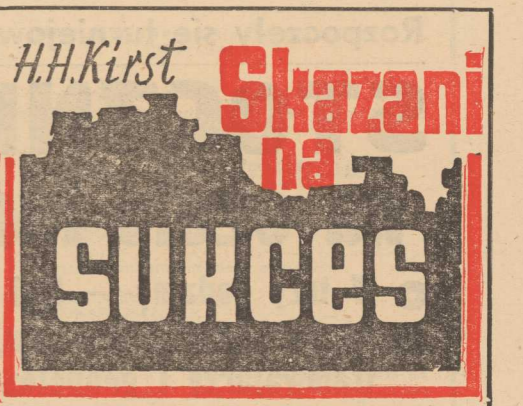
(Tytuł oryginalny: Verdammt zum Erfolg) Przekładała: Brygida Jodkowska