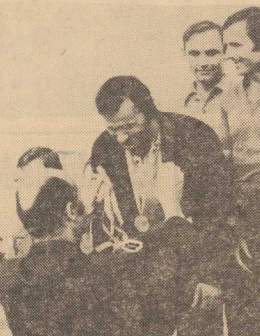
NA ZDJĘCIU: Dekoracja zwycięzców biegu sztafetowego mężczyzn powyżej 30 lat.