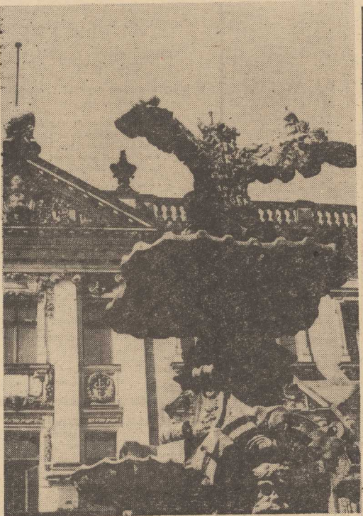
PO deszczowych dniach zrzanawała w Szczecinie prawdziwie złota jesień. W promieniach słońca kapie się jedna z najładniejszych szczecińskich fontann przy pl. Orła Białego.