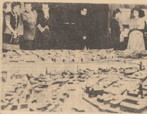
W BUDAPESZTEŃSKIM Muzeum Historycznym otwarto wystawę z okazji stulecia połączenia Peszu, Budy i Starej Budy. Na zdjęciu: makieta Budapesztu na wystawie jubileuszowej.

STOCZNIE radzieckie wybudują długie serie statków kontenerowych, masowców, jednostek dla transportu drewna oraz statków-chłodzi. Największym statkiem, jaki opuści w bieżącym pięcioletniu stocznie ra-