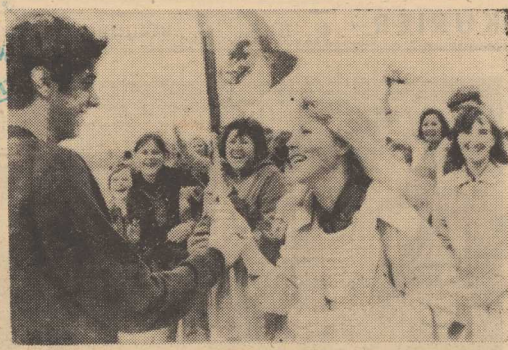
DO STOLICY NRD przybywają już z całego świata delegacje młodzieży na Festiwal. Na zdjęciu: powitanie delegatów z krajów Ameryki Łacińskiej.

Nr 174 (8963) Rok założenia 1945 Cena 50 gr