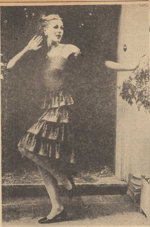
PIERWSZE TANGO w Wisłce można odtńczyć w takiej eleganckiej popołudniowej sukni ozdobionej cekinami. Do tego bodz i piór i powodzenie na wieczornych wycieczkach zapoznawczych murowane...