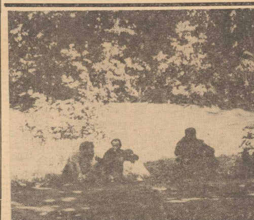
OTO FRAGMENT „pianej biesiady” na klombie przy ul. Kollątaja. Reszta komentów umknęła poza zasięg obiektywu naszego fotoreportera.

OD RED.: Już wiemy, kto jest gospodarzem pechowej piaskownicy. To Zarząd Zieleni Miejskiej, nie wiemy tylko kto odpowiada „głowa” za stan w jakim znajduje się piaskownica. Nie wątpimy jednak, że dyrekcja ZZZM zechce nas o tym poinformować.