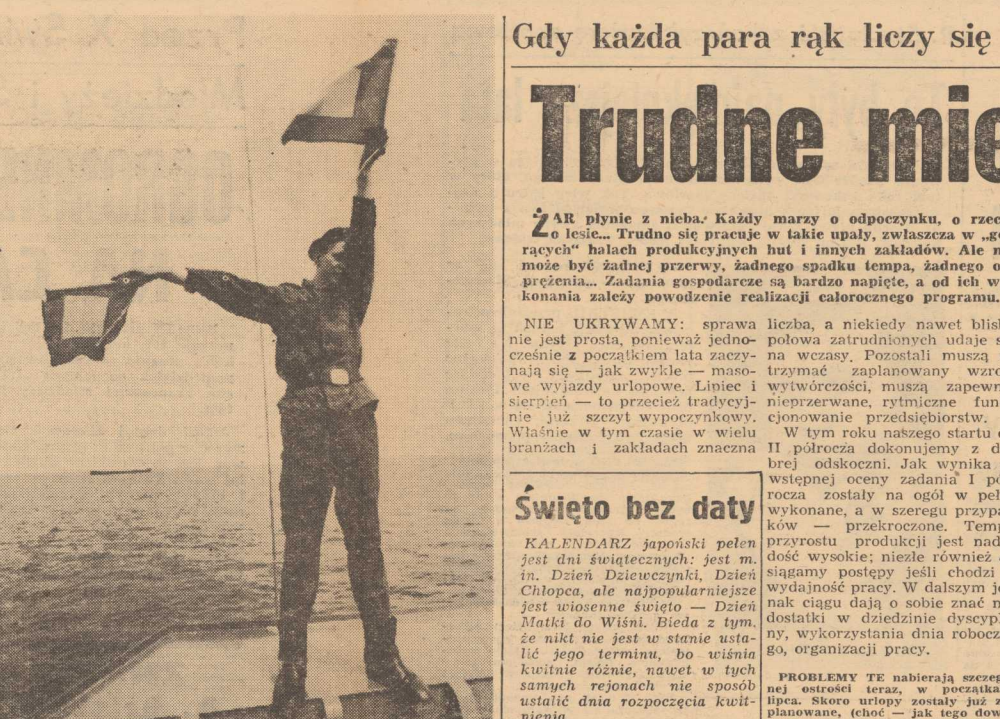
W tym czasie w wielu branżach i zakładach znacząca liczba, a niekiedy nawet blisko połowa zatrudnionych udaje się na wczasy. Pozostali muszą utrzymać zaplanowany wyrost wykroczeń, muszą zapewnić nieprzerwaną, rytmiczną funkcjonowanie przedsiębiorstw.

Odra jest naturalną drogą, wiążącą południe kraju — u przemysłowy Śląsk z oknem