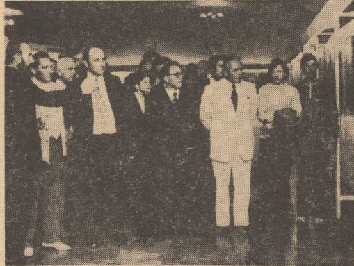
NA ZDJECIU: Goście uczestniczący w inauguracji V Prezentacji Malarzy z Krajów Socjalistycznych zwiedzają wystawę.