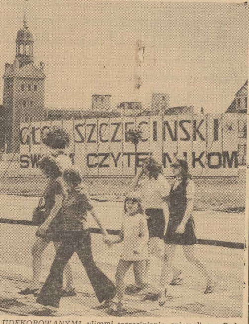
UDEKOROWANYMI ulicami szczecinianie śpieszyli na Podzamcze i Wały Chrobrego.