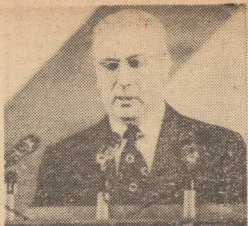
W PIERWSZYM dniu obrad II Kongresu Nauki Polskiej przemówienie wygłosił Edward Gierek.