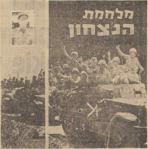
NA ZDJĘCIACH — okładka albumu „Six Days to Victory”, oraz zdjęcie ukazuje pobawiancia jeńców obywateli.