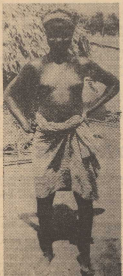
Dahomejska piękność.

W GENEWIE rozpoczęła się wczoraj czwarta runda rokowań między przedstawicielami organizacji zrzeszającej państwa eksportujące ropę naftową (OPEC) i reprezentantami zachodnich koncernów naftowych. Państwa OPEC domagają się 11,1 procentowej podwyżki cen ropy naftowej w związku z dewaluacją dolara.