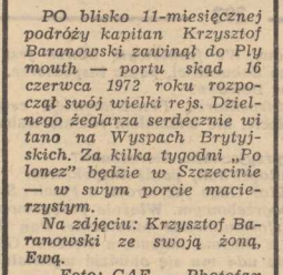
PO blisko 11-miesięcznej podróży kapitan Krzysztof Baranowski zawiązał do Plymouth — portu skąd 16 czerwca 1972 roku rozpoczął swój wielki rejs. Dzielnego żeglazka serdecznie witano na Wyspach Brytyjskich. Za kilka tygodni „Polonez” będzie w Szczecinie — w swym porcie macierzystym.

Zgłoszenia przyjmowane są w Zarządzie Okręgu PITK przy pl. Batorego 2. Tam też można zasięgnąć bliższych informacji dotyczących tej imprezy. (1g)