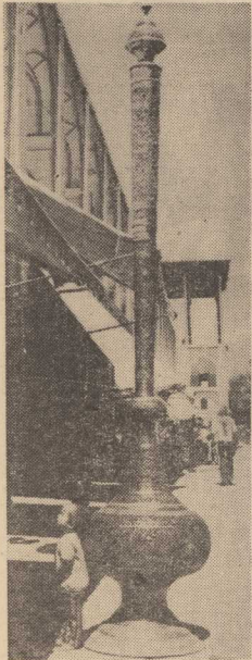
OBIEKTYWEM PRZEZ SWIAT — Iran. Na zdjęciu — jeden z ciekawych wyrobów irańskiego rzemieślników z Isfahanu.