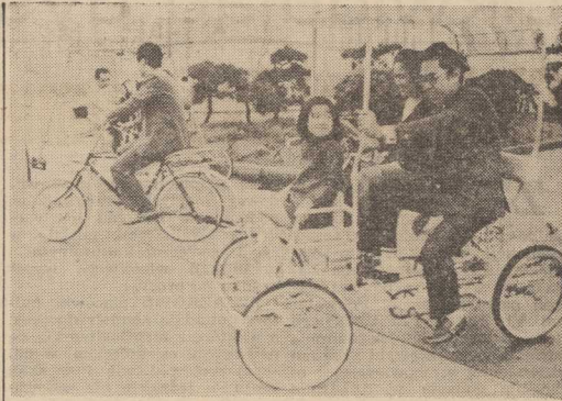
TAKIE niezwykle i o różnych kształtach rowery dla najmłodszych, starszych a nawet całych rodzin zaprezentowano na X Międzynarodowych Targach w Tokio. W czasie trwania ekspozycji zwiedzający mieli okazję wypróbować wystawione modele. Na zdjęciu: rower „familijski”, z którego może korzystać cała rodzina. (CAF—Pana Photo)

STANISŁAW LUKIANIENKO wiceminister żegluga morskiej ZSRR