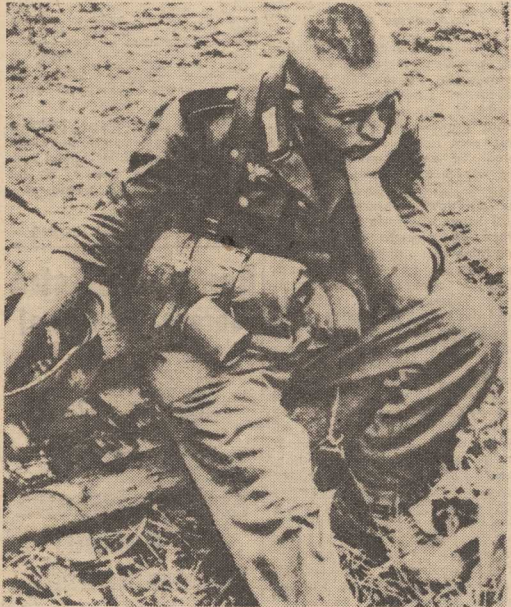
MAJ 1945 — KAPUTT!