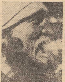
Autor korespondencji)