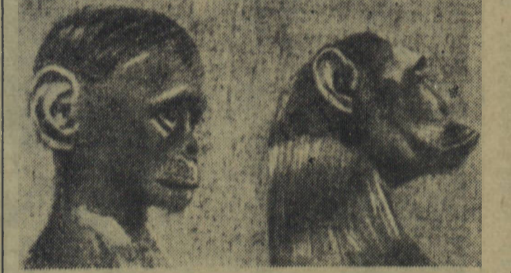
Rys. 2. - Porównanie młodego i dorosłego szympansa.