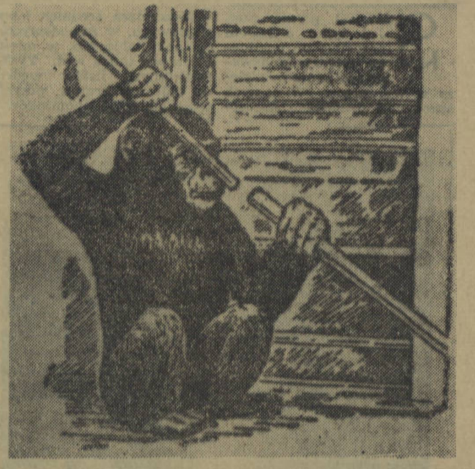
Rys. 4. - Szympan używa kilka krótkich kijów w jeden długi celem dosięgnięcia przysmaku.