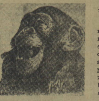
Rys. 3. - Mimika twarzy u szympansa - śmiech.