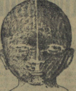
Rys. 1a. - Owłosienie zarodka człowieka.