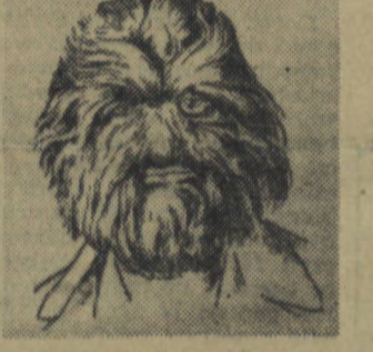
Rys. 1b. - Przykład nadmiernego owłosienia u człowieka.

Mimo istotnych różnic, wynikających z tych różnych dróg rozwoju, wiele cech człowieka i małp pozostało podobne.