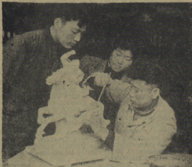
Student i wykładowcy wydziału rzeźby Centralnego Instytutu Sztuk Pięknych w Chinach, przebywający na praktyce w ośrodku wyrobów porcelanowych w prowincji Kiangsi, wykonują rzeźby z porcelany, przeznaczone na wystawę podczas V Światowego Festiwalu Młodzieży i Studentów w Warszawie.